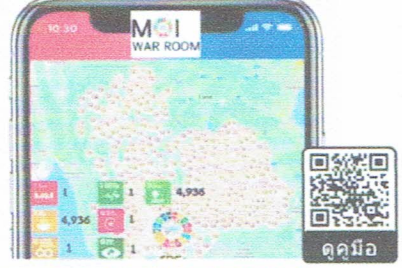
การจัดกิจกรรมวันดินโลก:กระทรวงมหาดไทย ปี 2566-2567 ธีม: ดินดี น้ำดี ชีวิตสุข อย่างยั่งยืน หรือ Sustainable Soil and Water for better life

หลัง จัดกิจกรรม https://moiwarmoom.dopa.go.th/