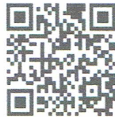
คู่มือการปักหมุด

๒. ขั้นตอนที่ ๒ ระหว่างจัดกิจกรรมให้ประเมินความพึงพอใจและความตระหนักรู้ผู้ร่วมงาน