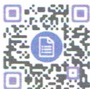
แบบฟอร์มประเมินความพึงพอใจ

๒. ขั้นตอนที่ ๒ ระหว่างจัดกิจกรรมให้ประเมินความพึงพอใจและความตระหนักรู้ผู้ร่วมงาน