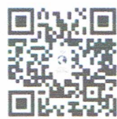
ปักหมุดก่อนจัดกิจกรรม

โดยสามารถศึกษาวิธีการผ่านคู่มือการปักหมุด