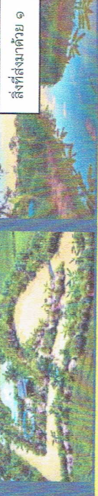
สิ่งที่ส่งมาด้วย ๑

เนื่องในโอกาสมหามงคลเฉลิมพระชนมพรรษา 72 พรรษา 28 กรกฎาคม 2567 ในภารกิจที่เกี่ยวข้องกับกระทรวงมหาดไทย