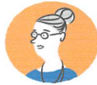
ประชาสังคม