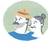
ประชาชน (ชุมชน)