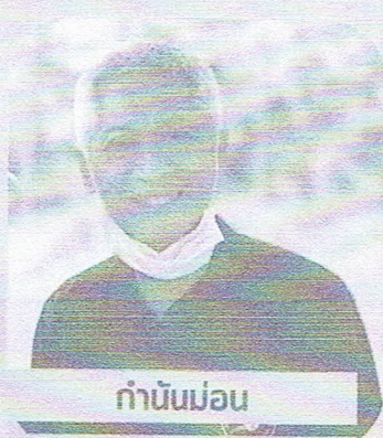
ท่านันม่อน