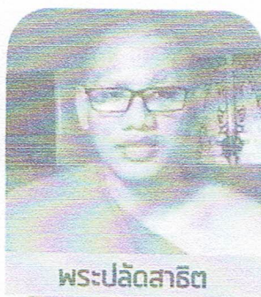
พระปลัดสาริต