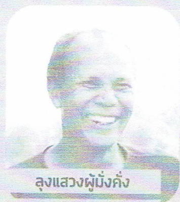
ลุงแสงผู้มั่งคั่ง