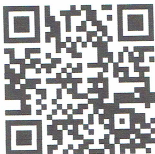
QR Code แบบสำรวจข้อมูลแจ้งความประสงค์ฯ