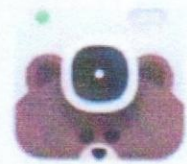
LINE Camera - by LINE Corporation