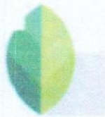
Snapseed Google LLC