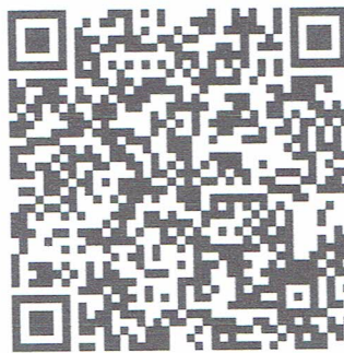
๒. การใช้งานระบบ TPMAP