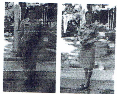
ชุดเครื่องแบบข้าราชการ

ตัวอย่างการแต่งกายของผู้เข้ารับการฝึกอบรม