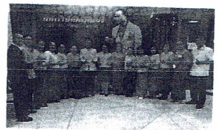
ชุดผ้าไทย