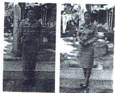
ชุดเครื่องแบบข้าราชการ

ตัวอย่างการแต่งกายของผู้เข้ารับการฝึกอบรม