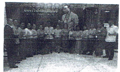
ชุดผ้าไทย